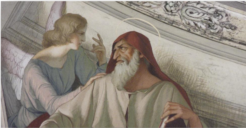
GIOVANNI CRESSERI, affresco evangelista Matteo, Santa Maria in Calchera Brescia.